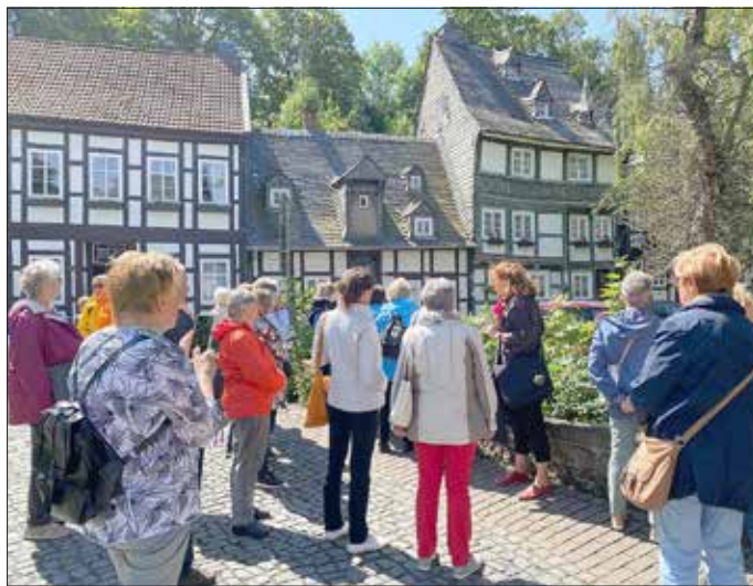
Während der Stadtführung