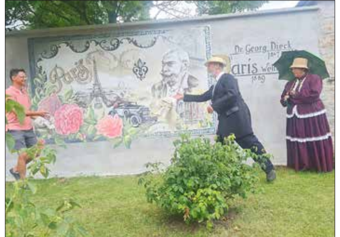
Enthüllung des Wandbildes

Bart, Beverwijk). Herzlichen Dank an unsere Gäste, an alle Akteure und vor allem an alle tatkräftigen Unterstützer. Auch die Kuchenkönigin 2024 war dabei.