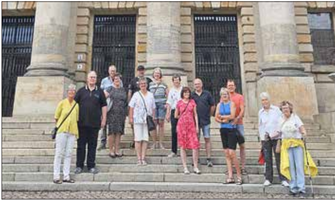
Auf der Treppe des Gerichts