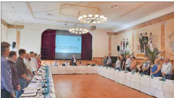
Konstituierende Stadtratssitzung am 11.07.2024 im Saal der „Linde“ Spergau

Nach der erfolgten Kommunalwahl am 9. Juni dieses Jahres trat der neu gewählte Stadtrat am 11.07.2024 zu seiner konstituierenden Sitzung zusammen.