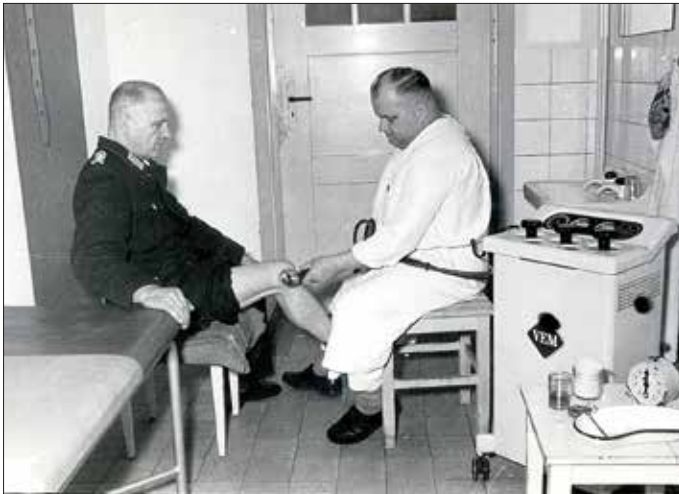
Kurzwellenbehandlung in den 60er Jahren des 20. Jh