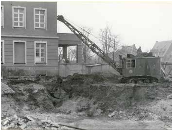
Tiefbauarbeiten für den Ostflügel; 1958